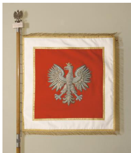
Sztandar Uczelni – druga strona.