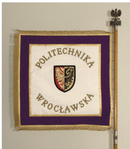
Sztandar Uczelni – pierwsza strona.