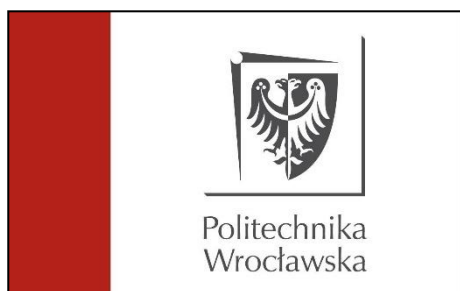
Wzór flagi Uczelni – wersja pozioma.