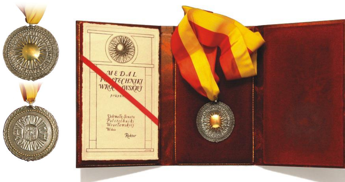
Medal za Wybitne Zasługi dla Rozwoju Politechniki Wrocławskiej.