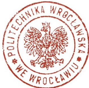
Wzór pieczęci Uczelni.