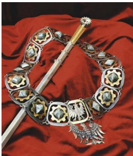
Łańcuch i berło Rektora.