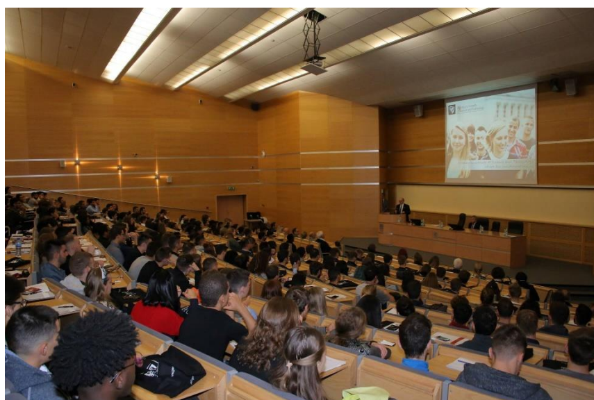
Dni Wstępne dla Obcokrajowców, D-20, 28.09.2018r.